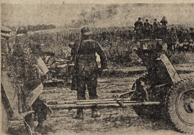
Ogień jest skierowany na lotnisko sowieckie. Artyleria przeciwlotnicza rozbrzmiewa jedną salwą za drugą.

TOKIO 30. 8. — Premier nowozelandzki Frazer, który bawi obecnie w Waszyngtonie, oświadczył przedstawicielom prasy amerykańskiej, że rząd nowozelandzki jest skłonny do jak najściślejszej współpracy z rządem Stanów Zjednoczonych w konflikcie z Japonią. Premier Frazer zaproponował w związku z tym rządowi amerykańskiemu stworzenie baz na wyspach Nowej Zelandii.