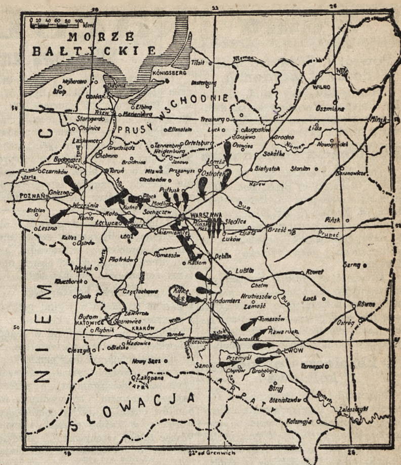
STAN FRONTÓW Z 14. 9. 1939 RANO

Propaganda francuska zapewnia, że taktyka dowództwa polskiego doprowadzi do zwycięstwa. Radio bry-