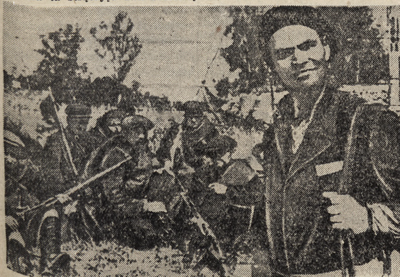
Na zdjęciu jedna z grup partyzantów stworzonych na polecenie Stalina, ze swym dowódcą (na prawo).

VICHY, 14. 9. — Według wiadomości nadesłanych z Oranu, miały tam miejsce w Plemcem oraz na znacznych przestrzeniach kraju silne zaburzenia atmosferyczne, połączone z burzami. Wielkich rozmiarów grad zniszczył zabudowania wiejskie ludności tubylczej, przy czym zginęło 10 osób, a wiele osób odniosło rany.