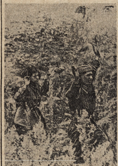
Partyzantka sowiecka wychodzi z ukrycia z podniesionymi rękami.

A tymczasem donoszą ze Sztokholmu, że Moskwa nie ukrywa swego niezadowolenia z powodu niedostatecznej pomocy ze strony Anglii. Sowiety bowiem nakładem wielkich ofiar zapewniły Anglii pewien okres wytchnienia, natomiast wysiłki Londynu w kierunku odciążenia Sowietów, nie stoją w żadnym stosunku do tych ofiar. Nieliczne oddziały angielskiego lotnictwa przysłane na front sowiecki nie stanowią realnej pomocy, zachęciły jedynie Sowiety do dalszego oporu.