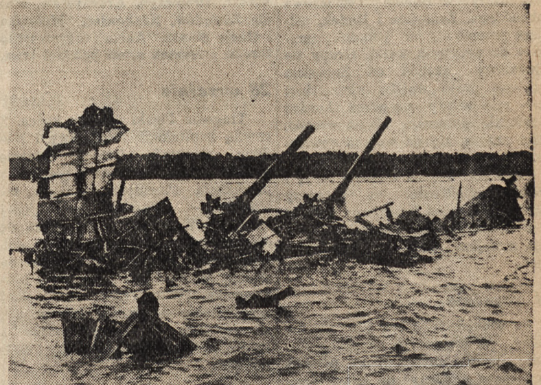
zatopiony przez lotnictwo niemieckie.