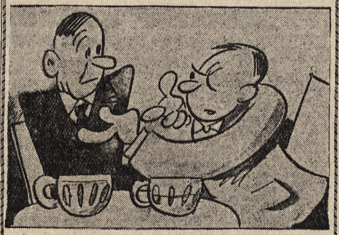
I proszę sobie wyobrazić, gdybym w ostatniej chwili nie skoczył w bok, rozmawiałby pan dziś z moimi zwłokami.