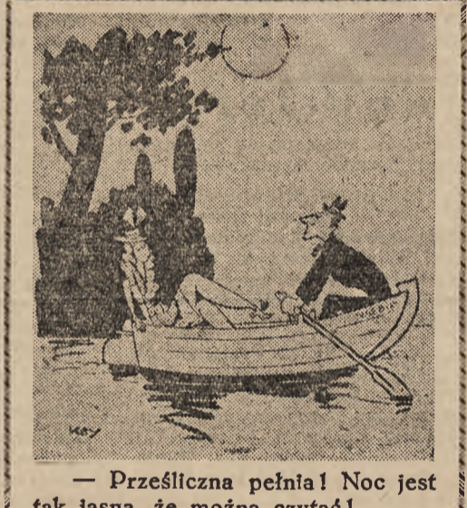
Prześlizna pełnia! Noc jest tak jasna, że można czytać!