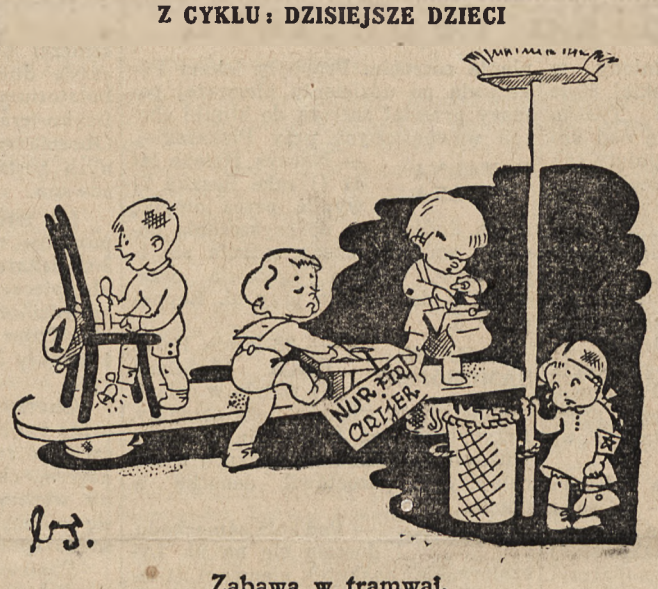
Zabawa w tramwaju.

dam za laboratorium dentystyczne. „Gazeta Lwowska“, „Dobre nr 6331“. 6331.