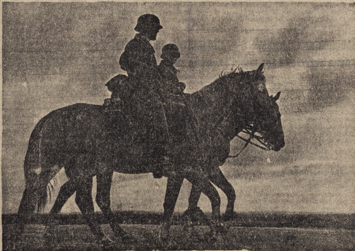
PATROL KONNY O ŚWICIE

WASZYNGTON, 13. 11. — Związki kowry urząd żeglarski przystąpi do zajmowania poważnej liczby statków amerykańskich żeglujących nadbrzeżnej. Jak informują „zynnik kompetentne, zajęciu uległy statki amerykańskie, odbywające rejsy z portów wybrzeża atlantyckiego do wybrzeża Pacyfiku.