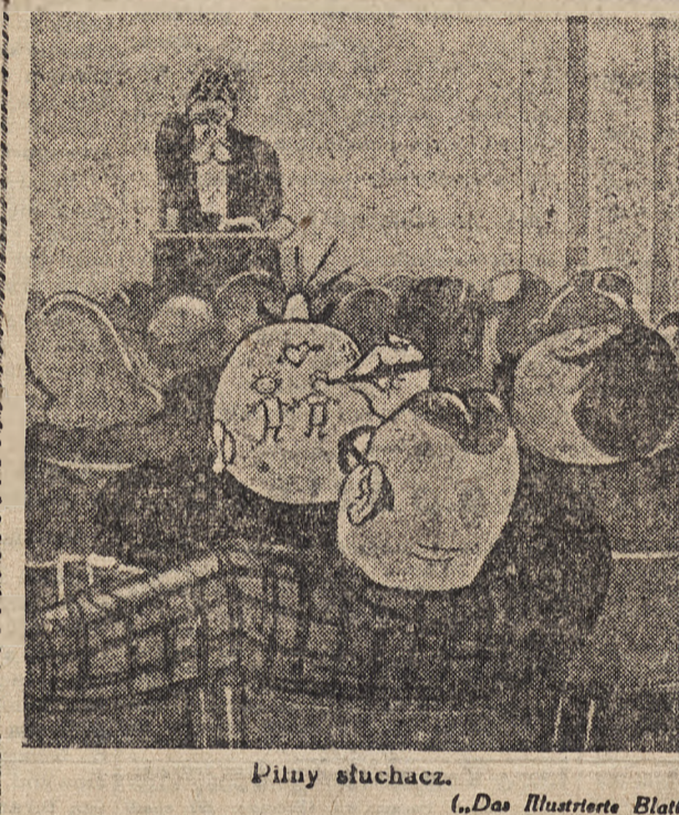
Pilny słuchacz. („Das Illustrierte Blatt”).

POKÓJ komfortowy z umeblowaniem w najlepszym stylu.