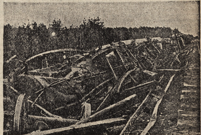
Sowiecki pociąg, złożony z wagonów - cystern zdruzgotany przez niemieckie nurkowce.