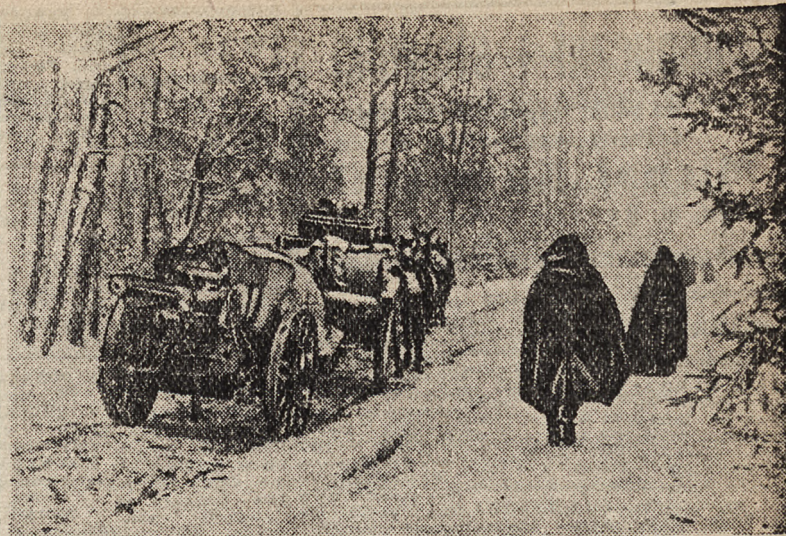
Marsz w śniegu. Białą całun pokrywa lasy i pola. Na zamrzniętych drogach nieprzerwanie ciągną bataliony niemieckie konne i zmotoryzowane maszerując na wschód.

Olbrzymie skarby ziemi uprawnej, pokłady i złoża surowców, wreszcie korzystnie rozmieszczone spławne drogi wodne stanowią bogactwa naturalne Rosji, których skali rozwoju w tej chwili nawet przewidzieć nie można. My te skarby, jak to oświadczył Führer, wykorzystamy dla dobra kontynentu. Że to nie może nastąpić z dnia na dzień, wiemy. Lecz nie straszne dla nas te olbrzymie zadania. Podejmiemy do ich realizacji planowo. A jak je urzeczywistnimy, najbliższy czas pokaże.