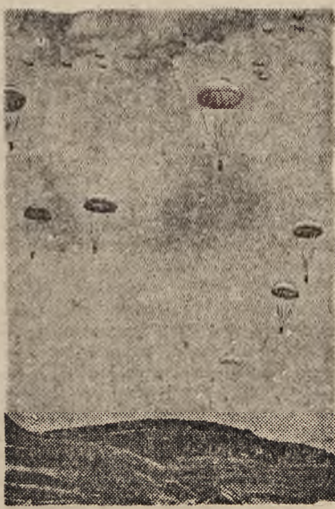
Przy pomocy spadochronów zaopatrza Japończycy swoje oddziały w górach Szanai.