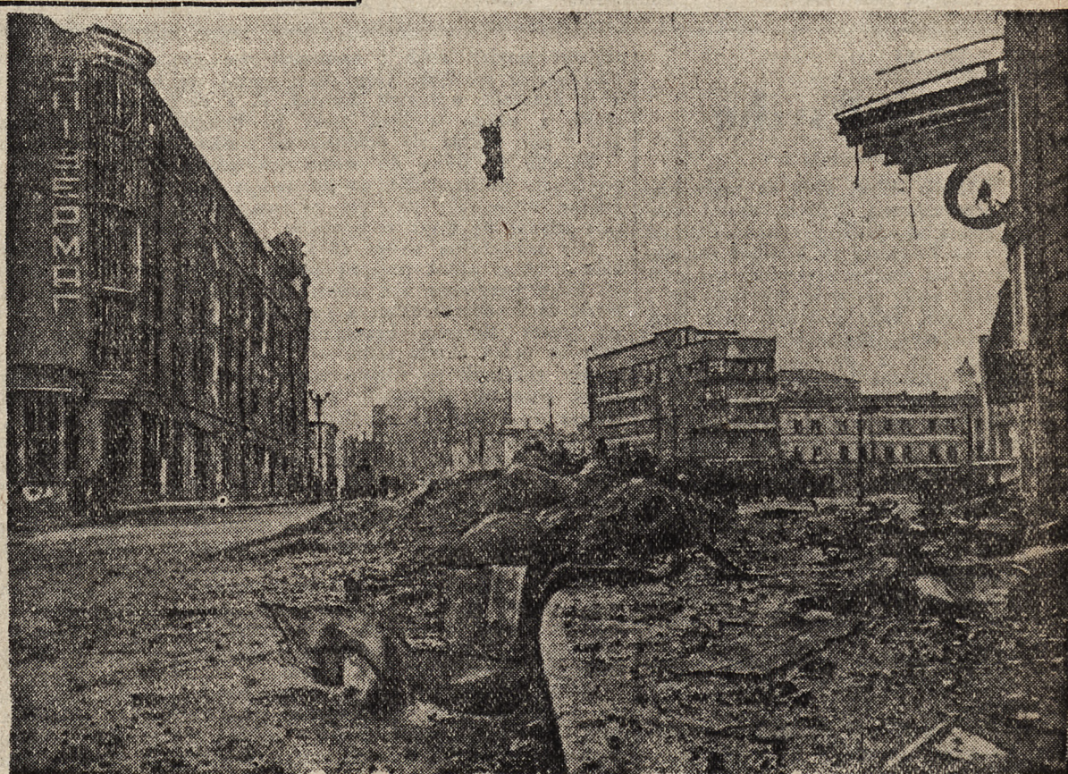
Ślady zaciętych walk ulicznych w Charków, ie.