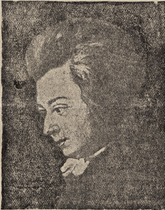
Portret W. A. Mozarta z nieukończzonego obrazu Józefa Langego.

Następne lata, w których zaprzyjaźnił się z Haydnem i innymi mistrzami, otwierają mu progę dworów wiedeńskiego i berlińskiego, pałaców i salonów arystokracji, których staje się bożyszczem. Goethe i Napoleon podziwiają go. Gwiazda Mozarta zajaśniała na niemieckim firmamencie muzycznym olśniewającym blaskiem. Opery „Wesele Figara“, „Cosi fan tutte“, „Don Giovanni“ i wreszcie „Flet Zaczarowany“, który zamówiony i wystawiony przez Schikanedera, doczekał się stu spektakli pod rząd, rozstały się jego imię na cały świat. A jednak wbrew przekonaniu, słonecznemu optymizmowi, jakim tchnie jego muzyka pełna melodyjnej słodyczy i beztrudnego — pozornie tylko — uroku, dokonuje się niepowstrzymanie w ślad za nieustającymi troskami materialnymi i w atmosferze martyrologii małżeńskiej, jego upadek fizyczny i społeczny. Dwie ostatnie symfonie G-moll i C-dur (Jupiter) nie sprzeniewierając się harmonii form w monumentalnym rysunku architektonicznym, zleją już namiętnym technieniem przepaściściwych konfliktów duchowych, cierpięcej rezygnacji i wewnętrznych walk pełnych wstrząsającego tragizmu.