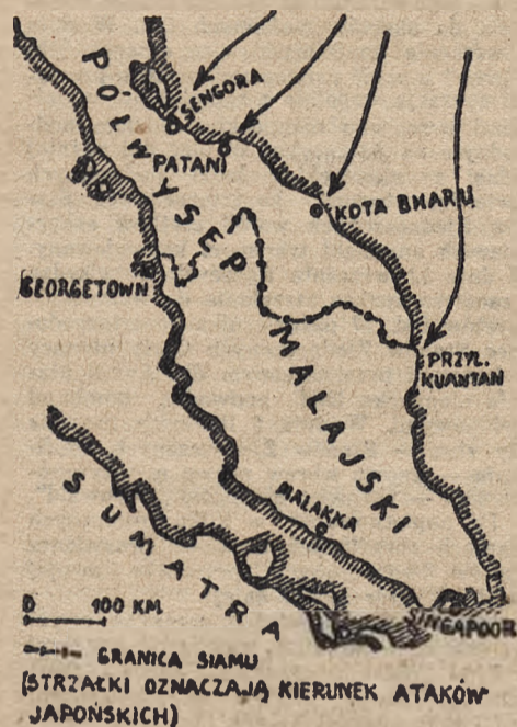
100 KM GRANICA SIAMU (STRZAŁKI OZNACZAJĄ KIERUNEK ATAKÓW JAPONSKICH)

Działania na wyspie Luzon mają raczej charakter lokalny, natomiast operacje armii japońskiej na Półwyspie Malajskim kryją w sobie szerokie możliwości strategiczne i w razie powodzenia, mogą mieć daleko idące następstwa dla całokształtu wojny. Gdy utrata Manili byłaby dla Ameryki i Anglii bardzo bolesna bez decydującego znaczenia, to utrata Singapuru stanowiłaby cios wymierzony w samo serce amerykańskich i angielskich punktów oporu. Aby zrozumieć, na czym polega niebezpieczeństwo grożące tej najpotężniejszej twierdzy świata, za jaką uważano w Londynie Singapur, przyjrzyjmy się uważnie załączonej mapie.