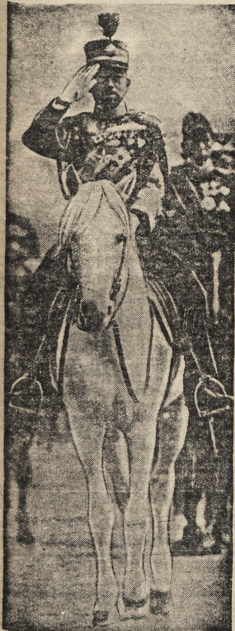
TENNO — JAK JAPONCZYCY NAZYWAJĄ SWEGO CESARZA — ODBYWA REWIE WOJSK

BERLIN, 18. 12. — W czasie od 10 czerwca 1940 do końca sierpnia 1941, włoskie łodzie podwodne, operujące u boku niemieckich sił morskich, zatopiły na Oceanie Atlantyckim 62 brytyjskie okręty handlowe o łącznej pojemności 401.440 brt., w tym 12 parowców-cystern o pojemności 89.525 brt. Z brytyjskiej floty wojennej włoskie łodzie podwodne zatopiły 1 lekki krążownik, 3 kontrtorpedowce i 4 krążowniki pomocnicze. Sukcesy te posiadają tym większe znaczenie, że włoska marynarka wojenna po raz pierwszy od chwili swego powstania operowała na Atlantyku.