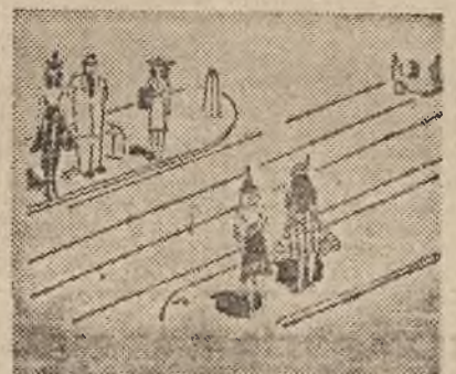
NA TRAMWAJ OCZEKUJ NA WYSEPCE, ALBO NA SKRAJU CHODNIKA.

jak i osoby prowadzące rowery czy taczki.