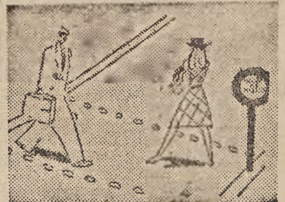
PRZEKRACZAJ JEZDNIĘ TYLKO W OZNACZONYCH MIEJSCACH.

Przechodnie, którzy niosą przedmioty mogące utrudniać ruch pieszy (np. drabiny), muszą używać skrajnej prawej strony jezdni, tak samo