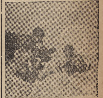
WAKACJE — A WIĘC KSIĄŻKI W KĄT, SŁOŃCE NA PLECY, A KARTY W REKĘ

Trochę dalej, na uboczu, on i ona. Początkowo ona coś mówi szeptem, on słucha w zadumie. Nie trudno zgadnąć, z jakiej dziedziny mogą być te zwierzenia... Zmorzyl ich jednak sen, z którego zbudzi ich dopiero chłód wieczoru. A gdy słońca zaczyna chylić się ku zachodowi, tłumy ściągają do domów — opalone, rozbawione, odurzone ruchem, powietrzem, szczęśliwe swobodą i przeżyciem kilku beztrudnych chwil.