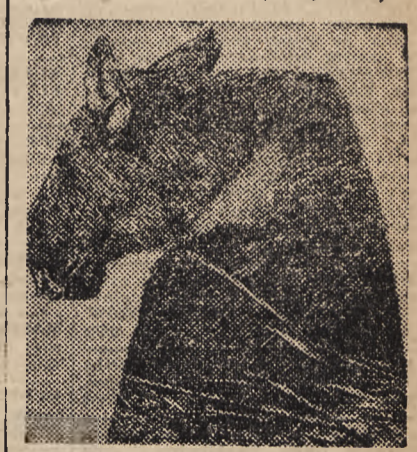
MŁODA ŁOSICA („Klempa”) przed pierwszymi godami