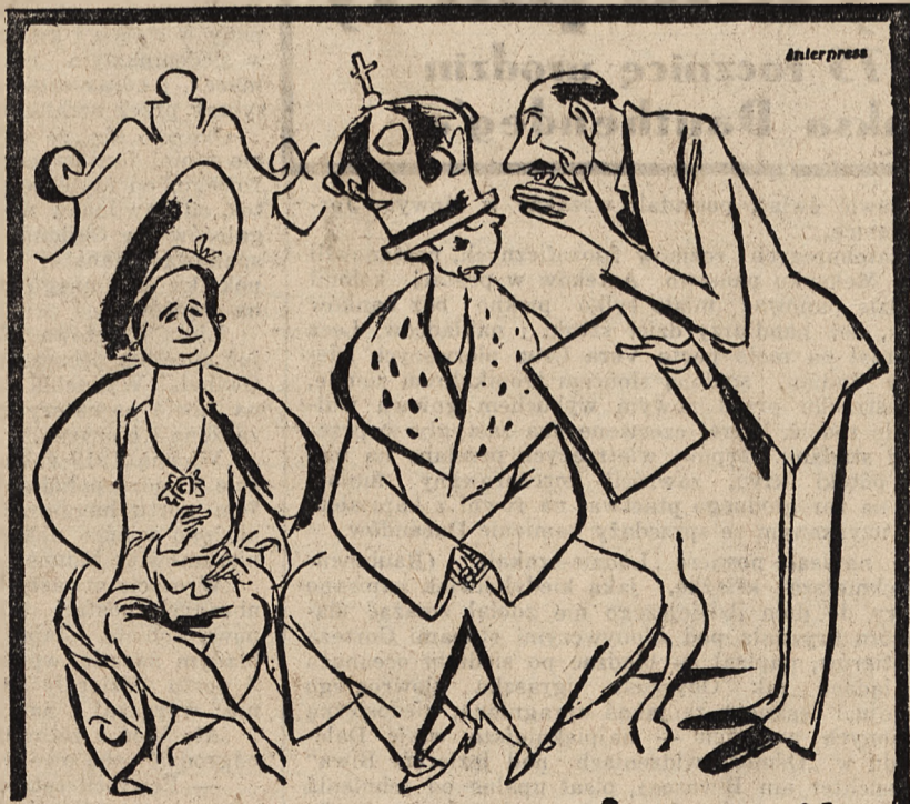
— Sir! Nikaragwę trzeba obrobić, aby Niemcom wypowiedziała wojnę! — Nikarague? — Wodospad? (Interpress).

też bronić się będę do ostatniej kropli krwi”. Pod osłoną dwóch krążowników angielskich, jak również czterech kontrtorpedowców i samolotów, które wystartowały z pewnego lotniska, korpus ekspedycyjny przywieziony na dwóch statkach transportowych zdołał wylądować. Francuski krążownik pomocniczy „Bougainville” oraz inny statek zostały zatopione przez Anglików. Załogi obydwu statków zdołały się uratować. Po stronie angielskiej zniszczono 7 wozów pancernych oraz zestrzelono 3 samoloty. Obrona, w czasie której Francuzi walczyli przeciwko pięciokrotnej przewadze, trwała 3 dni. Anglicy użyli w akcji 23 statki wojenne, w tym 5 wielkich, 12 średnich i 6 małych jednostek.