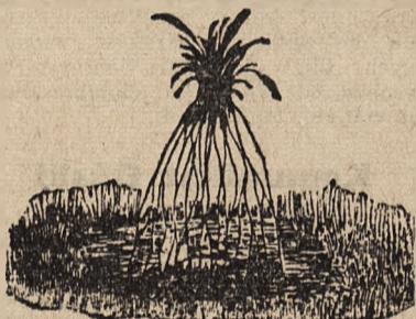
„Przepiórka“ z ostatnich kłosów.

Podstawą dożynek jest oddanie właścicielowi gruntu wianka zbożo-