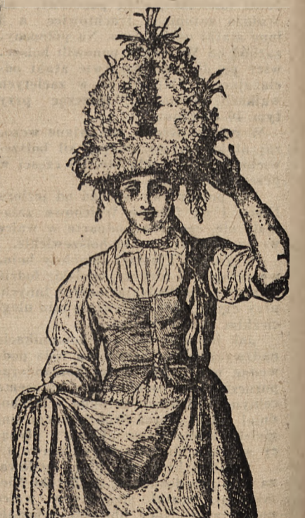
Przędownica w wieniec na głowie.

Na tym kończą się obrzędy dożynkowe. Żniwiarze dokonali swej zbożnej pracy i przynieśli zboże do domu. Widocznym tego znakiem jest właśnie wieniec, który opozostaje na miejscu honorowym w przechowaniu aż do następnego siewu, czy żniwu.