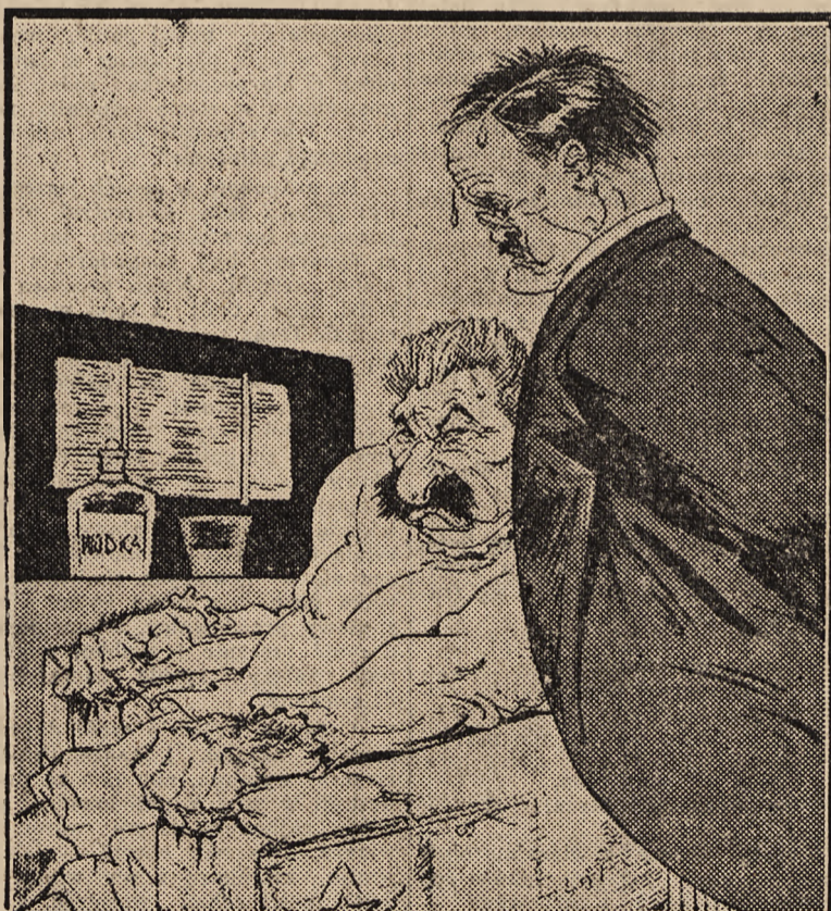
— Te cwaniaki udają, że wierzą w nasze zblagowane zwycięstwa i pod tym pozorem wykręcają się od przysłania obiecanej pomocy! („Kladderadscht“).

(tp) SZTOKHOLM, 12. 8. — Również żona Gandhiego została aresztowana w dniu wczorajszym. Angielskie biuro informacyjne Reuter potwierdza tą wiadomość. W związku z aresztowaniem Gandhiego podano do wiadomości w niedzielę wieczór następujące szczegóły: rano około godz. 5-ej zjawiły się przed domem Gandhiego trzy samochody policyjne. Gandhiego obudzono i odprowadzono do jednego z tych samochodów. W chwili kiedy opuszczał on mieszkanie, mężczyźni i kobiety zgromadzeni przed domem wolałi: „Niech żyje Gandhi!“ Reuter komunikuje, że tym razem areszt Gandhiego ma mieć ostrzejszy charakter.