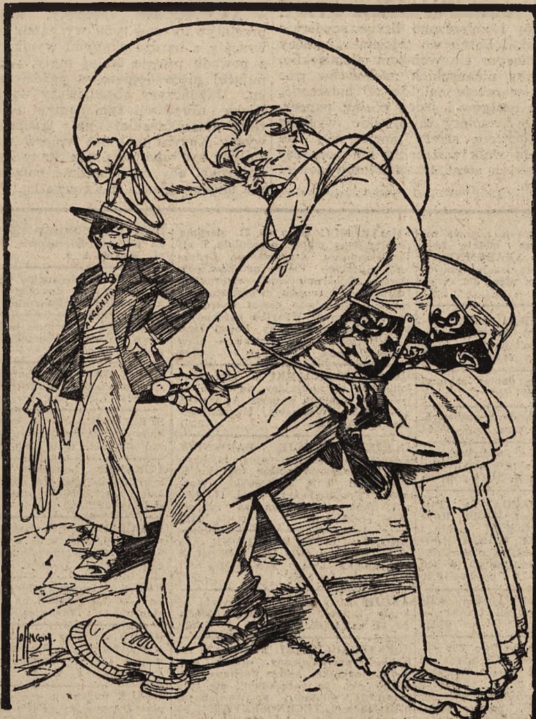
ROOSEVELT: Na Argentynie mam sposób jej własny! (Kladderadatsch).

(tp) TOKIO, 28. 8. — Wbrew angielskiej agitacji, sytuacja w Indiach pogarsza się stale, — tak twierdzi dzisiaj „Czugiuri Szogio Szimpo” w dłuższym komentarzu do wiadomości otrzymanych o panujących niepokojach w różnych częściach Indji. Do jakiego stopnia jest sytuacja naprężona, świadczy fakt, że Sipajowie, stojący pod dowództwem angielskich oficerów, skłaniają swoje sympatie w stronę Hindusów.