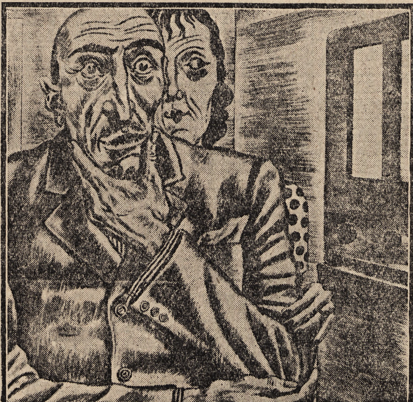
W RADIO U. S. A.: Uwaga! Uwaga! Nieprzyjaciół przy zatopieniu naszych okrętów wojennych stracił dwie torpedy.

(tp) SZTOKHOLM, 3. 9. — Prezydent Brazylii Vargas, według doniesienia londyńskiej służby informacyjnej z Rio de Janeiro, zarządził zaciemnienie na terenie całej Brazylii.