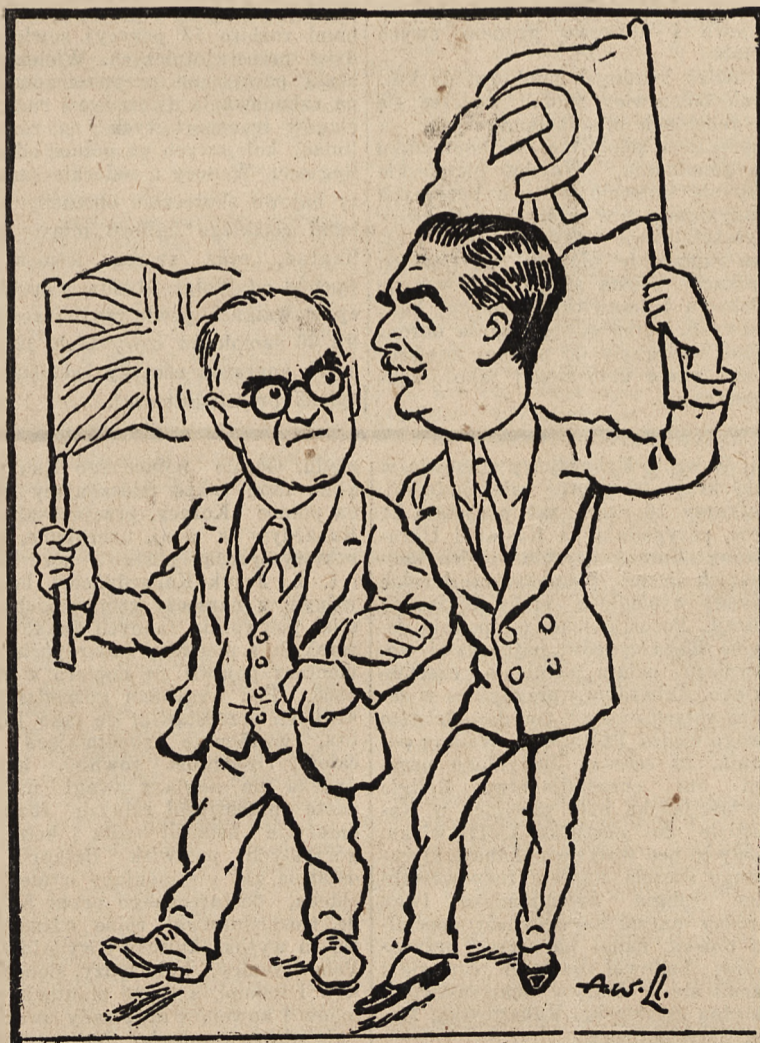
Minister Eden za pan brat z komunistą angielskim Gallacherem. (Karykatura angielska z r. 1941 „Punch“).

(tp) TOKIO, 7. 9. — Szef oddziału marynarki oświadczył w Szonan, iż od dnia 9 czerwca do dnia dzisiejszego wydobyto ogółem 94 statki z wód w pobliżu Szonan. Wśród wydobytych jednostek znajdują się jednostki o różnych wielkościach, od wielkich parowców począwszy a skończywszy na małych dżonkach.