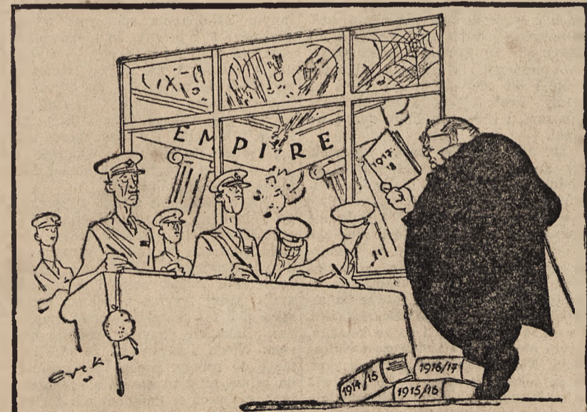
LEKCJA STRATEGII. — Churchill: Proszę nie zwracać uwagi na to, co się dzieje na dworze, gentlemen... dochodzimy więc do roku 1917/18. (Das Reich).

ANKARA, 19. 9. — Na granicy turecko-sowieckiej zaszły w ostatnich dniach ponowne wypadki przejścia w różnych miejscach dezertorów sowieckich. Zostali oni internowani przez właściwe tureckie władze wojskowe.