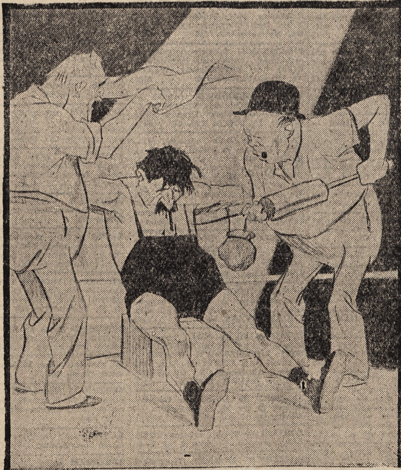
Zmęczony zapaśnik otrzymuje zastrzyki. („Kladderadatsch“).