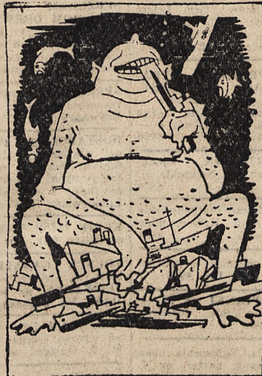
Nienasycony pożeracz tonażu alianckiego — Atlantyk. („Stürmer”).

Na innych obszarach wodnych Atlantyku, od wybrzeża afrykańskiego do amerykańskiego, niemieckie łodzie podwodne zatopili jeszcze dalszych 11 statków o pojemności 57.000 ton, tak że ogólna suma strat żeglugi alianckiej w ostatnich czterech dniach wyniosła znowu 14 statków o pojemności 104.000 ton.