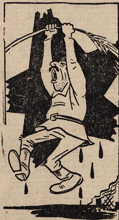
STALIN DO NARODÓW ANGLOSASKICH: „LUDY, RATUJCIE!”

NANKIN, 8. 10. — Prezydent Wanczingwei w charakterze premiera chińskiego rządu narodowego odbył konferencję w sprawie szeregu ważnych zagadnień z trzema specjalnymi posłami japońskimi, baronem Hiranuma, Arita i Nagai. W komunikacie wydanym dla prasy na temat tych konferencji minister informacji Kuosiu-feng dodał, że powyższe rozmowy były bardzo doniosłe i ważne i mogą wpłynąć na przyszłość Azji Wschodniej oraz reżimu Czungkingu.