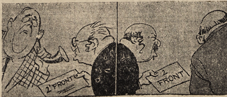
GŁOS WOŁAJĄCEGO NA PUSZCZY.

RZYM, 20. 10. — Włoski komunikat wojenny z poniedziałku brzmi: Spokojny dzień na całym froncie egipskim. Atak lotniczy na Benghasi wywołał nieznaczne szkody w budynkach mieszkalnych. Wśród ludności cywilnej jedna osoba została zabita zaś trzy ranne. W pobliżu Solium wzięto do niewoli załogę jednego z zestrzelonych samolotów, złożoną z 4-ch Anglików i jednego Nowozelandczyka. Samoloty mocarstw Osi atakowały lotniska w Micabba i uzyskały cenne trafienia w obiekty i pola startowe. Jeden z włoskich samolotów nie powrócił z lotu na nieprzyjaciela.