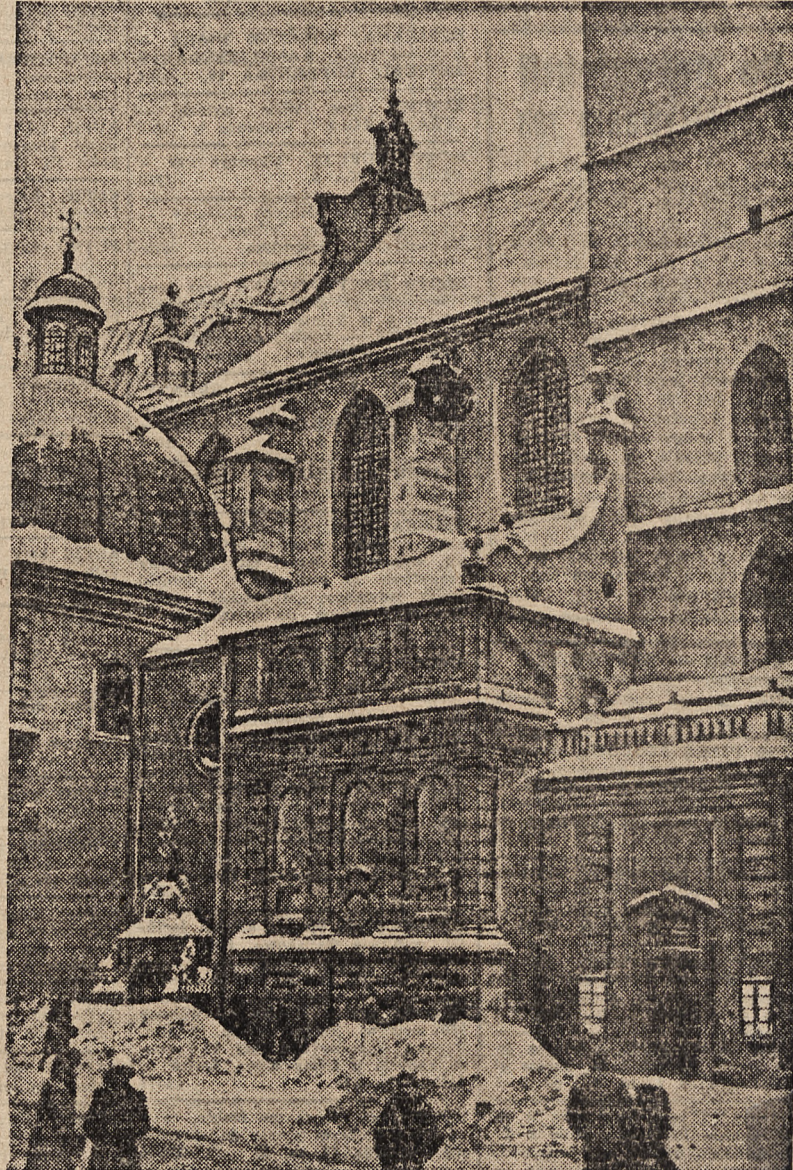
Kaplica Kampianów przy Katedrze Łacińskiej.