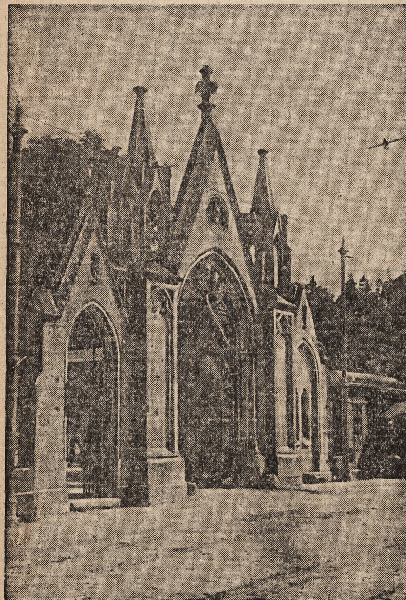
U wrót cmentarza Łyczakowskiego