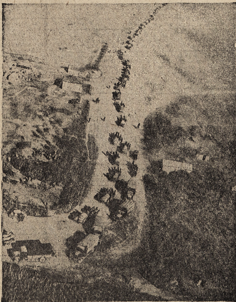
Pochód niemieckich kolumn za opatrzenia na froncie Tereku.

RZYM, 3. 11. — Głównodowodzący brytyjskiej ósmej armii w Egipcie generał Alexander według komunikatu frontowego agencji Stefani, runął podobno z samolotem podczas lotu nad terenem boju na froncie El Alamein. O stanie jego zdrowia brak jeszcze pewnych danych, według zeznań jeńców jednak generał Alexander będzie potrzebował wielu tygodni odpoczynku.