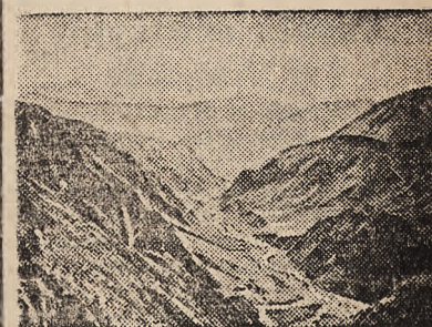
Przełęcz z drogą wiodącą do Tuapse.