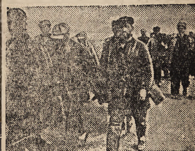
Jeńcy bolszewicki z walk nad rzeką Terek.