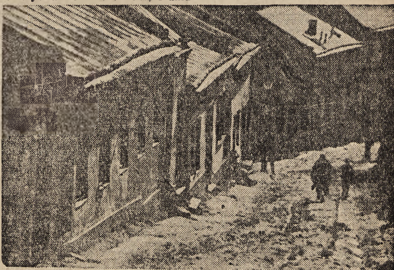
ULICZKA LWIA U STÓP GÓRY ZAMKOWEJ.