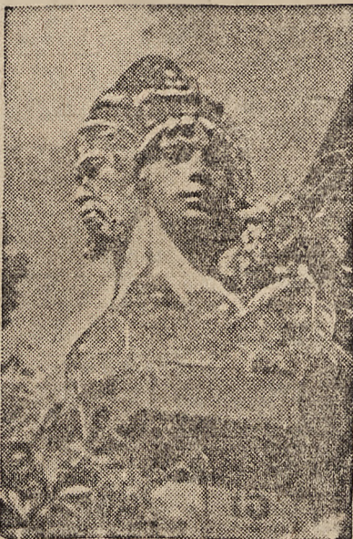
SŁOWIAŃSKI ŚWIATOWIT, CZY RZYMSKI JANUS? — (fragment z ulicy Piaskowej).

Miedzy świętym Piotrem i Antonim, na stokach Góry Zamkowej przez