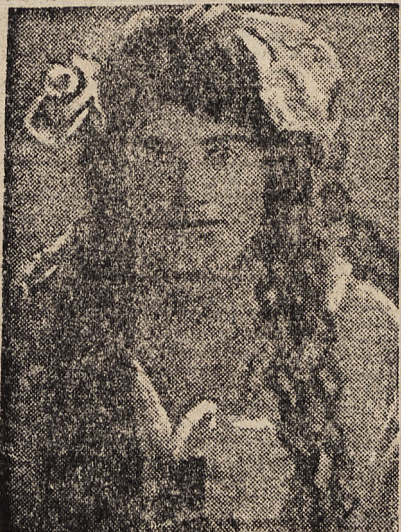
Znakomita artystka Agnes Sorma w roli Rusałki.

Postanawia rzucić dom i rodzinę. Dość jest miłości w matce jego dzieci, aby ta miłość wystarczała tym dzieciom, dość jest szczęścia w dzieciach, aby to szczęście wystarczyło matce. Mistrz Henryk opuszcza tedy żonę i dążąc za przewodem Ru-