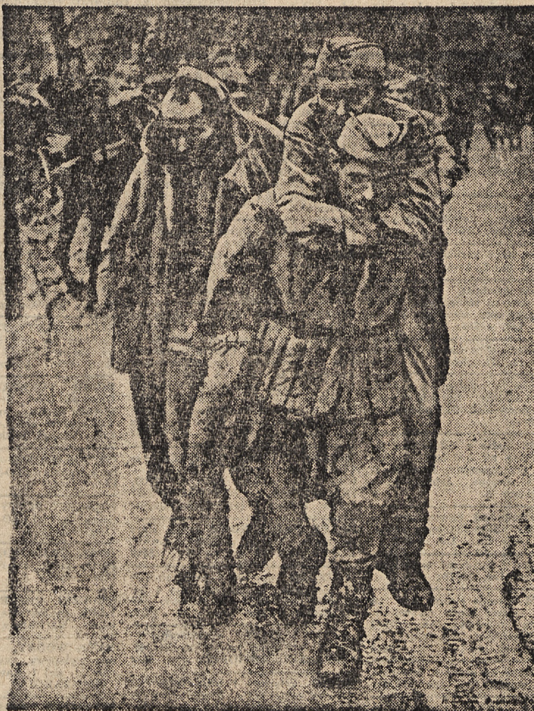
Trzech z 18.300 jeńców wziętych w niedawnej bitwie nad rzeką Terek.

W czasie tych walk zaczepnych stracili bolszewicy 45 czołgów, 4 pancerne wozy zwiadowcze, 29 dział, 36 samochodów ciężarowych, przeszło 100 karabinów maszynowych i granatników oraz około 300 jeńców. W czasie dalszych przeciwwypadów na środkowym odcinku frontu bolszewicy stracili 19 czołgów, 15 pancernych wozów zwiadowczych, 109 zmotoryzowanych i konnych zaprzęgów magazyny amunicji, broni oraz dalszych 200 jeńców. Samoloty bojowe typu „Ju 88” i „Hell” bombardowały wielokrotnie punkty zbrojne i kwatery wojskowe oraz mniejsze miejscowości służące jako bazy zaopatrzeniowe.