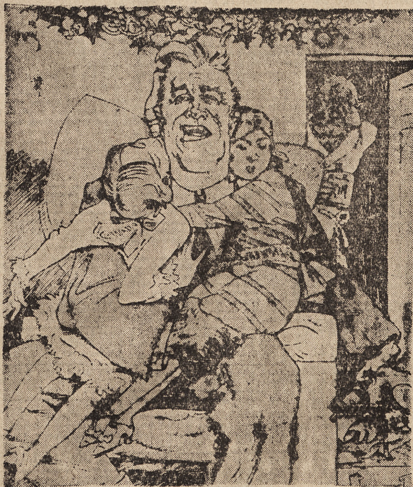
Wieczór wigilijny amerykańskiego wujaszka

BUDAPESZT, 29. 12. — Węgierski minister spraw wewnętrznych podkreślił, iż urządzenie balów i wieczorków tanecznych jest nie na czasie i polecił władzom administracyjnym, by nie udzielały zezwoleń na odbywanie imprez karnawałowych. Można natomiast zezwalać na urządzenie skromnych imprez przy przestrzeganiu godziny policyjnej tj. 23-ciej. Począwszy od 10 marca również tego rodzaju rozrywki będą wzbronione.