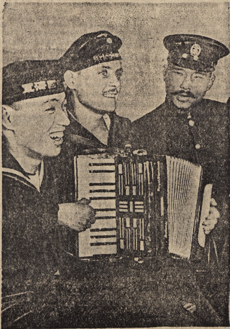
Japończycy i niemieccy marynarze bawią się wspólnie.