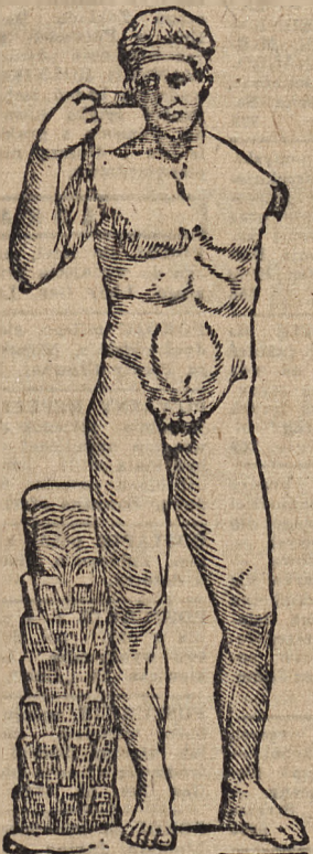
Atleta grecki (t. zw. „Diadomeos”), dzieło Polykleta.

Światło hellenickie w znaczeniu czysto malarskim to zagadnienie, którym się plastyka Europy dotychczas nie zajmowała. Po prostu nie zwróciła na to zjawisko uwagi. Pejzażystom dzisiejszym nie o tym nie wiadomo. Te lasy oliwkowe, ten osobliwy, odmienny od włoskiego lazuru morza, te dalekie zarysy pasem górskich skąpanych w oddechu palącego słońca, ta wreszcie spokojność i prostota zjawisk świetlnych — czekają jeszcze na upamiętnienie pędzlem znakomitego malarza.