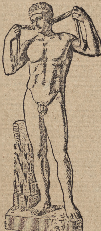
Ta sama rzeźba po nowoczesnym uzupełnieniu.