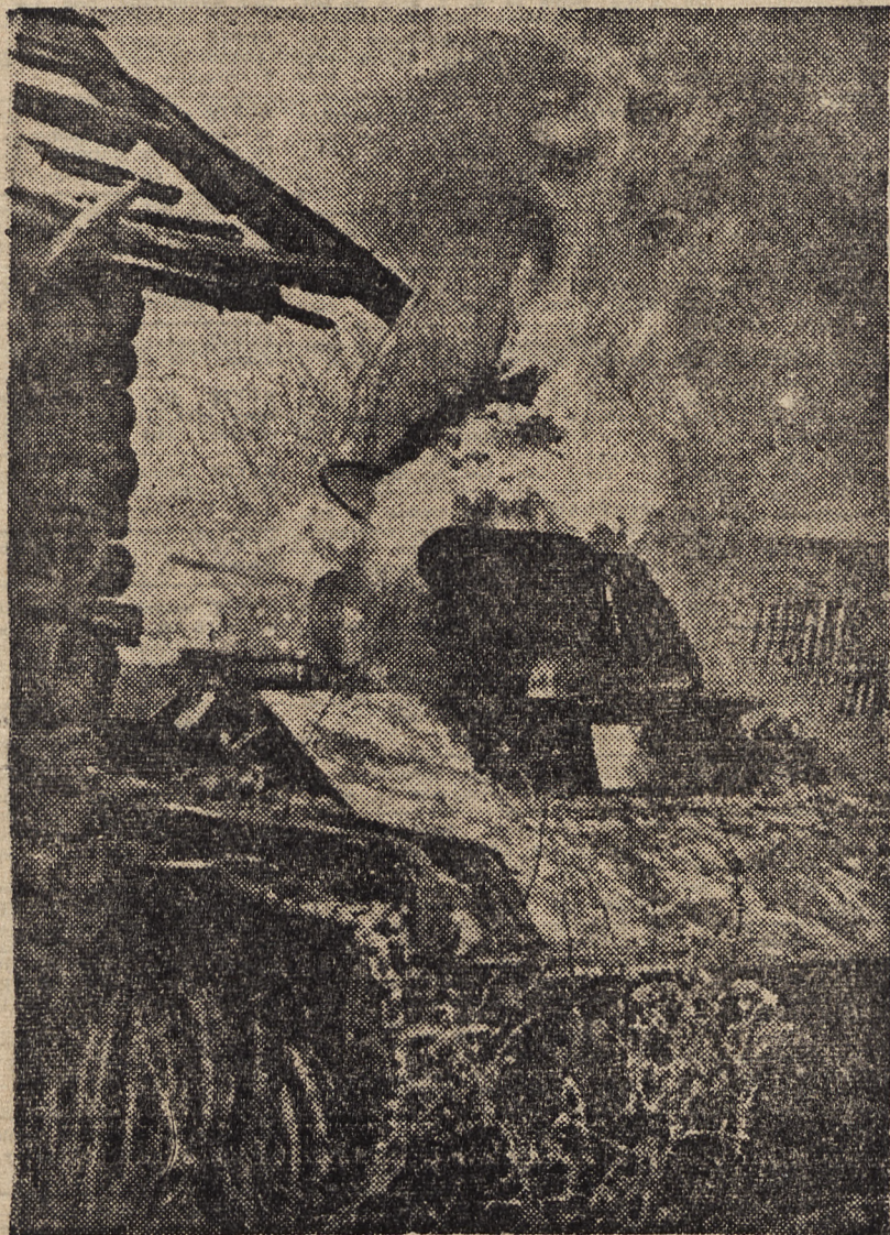
ZAPASY BRONI PANCERNEJ NA FRONCIE WSCHODNIM

BUKARESZT, 4. 2. — Pomyślne warunki glebowe i klimatyczne w południowej Besarabii, skłoniły administrację tej prowincji do popierania uprawy ryżu. Plantacja ześrodkowana ma być w miejscowości Ismail nad Dunajem. Już na wiosnę należy się liczyć z obsianiem 218 ha ziemi przeznaczonej pod uprawę ryżu.