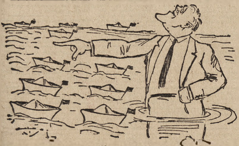
Seryjna produkcja okrętów w USA wzrasta w tempie astronomicznym.

SZTOKHOLM, 15. 3. — Jak podaje Reuter, w nocy na sobotę przybył minister spraw zagranicznych Eden na żądanie rządu Stanów Zjednoczonych do Waszyngtonu.