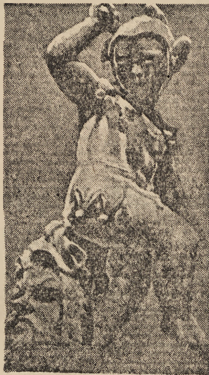
Kwiecień w rzeźbie w wiedeńskim Belwederze.

PRZEMYSŁ W OKRĘGU KOŁOMYJSKIM. — Położony z dala od wielkich ośrodków fabrycznych i