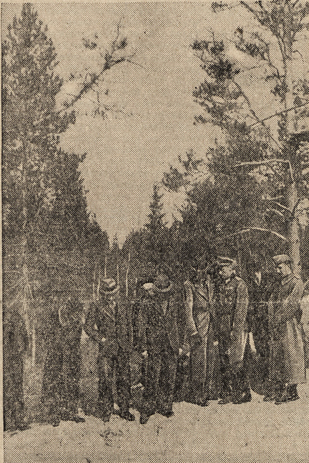
Komisja P. C. K. nad masowym grobem.

Nota sowiecka do Sikorskiego obok swej strony kryminalnej posiada też doniosłe znaczenie polityczne. Dokument sowiecki został wprawdzie doręczony przedstawicielowi Sikorskiego w Kujbyszewie hr. Romerowi. W rzeczywistości jednak był on zwrócony nie tyle pod adresem polskich emigrantów, ile pod adresem rządu Wielkiej Brytanii i Stanów Zjednoczonych. W sposób nie dopuszczający żadnych dwuznaczności Stalin daje w niej do zrozumienia, że nie życzy sobie żadnych dalszych dyskusji na temat działań lub zaniedbań bolszewizmu w okresie wojny czy pokoju. Rząd sowiecki daje w tej nocie do poznania, że prowadzi wojnę według swoich metod