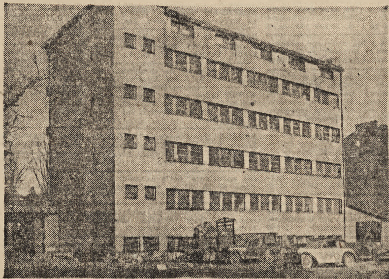
WIELOPIĘTROWY GMACH FABRYCZNY MIESCI W SOBIE JEDYNĄ W GALICJI RAFINERIĘ MIODU.

Lwowska oczyszczalnia miodu rozpoczęła swą działalność ograniczając się na razie ściśle do wykonania swego zadania. W przyszłości kierownictwo jej zamierza rozszerzyć jej cele, a mianowicie przez stworzenie przy fabryce działu sprzedaży; a w nim pszczelarze mogliby nabywać wszelki sprzęt potrzebny w pasiece. Sprzęt ten miałby być jak najbardziej odpowiadający współczesnym zasadom hodowli pszczół.