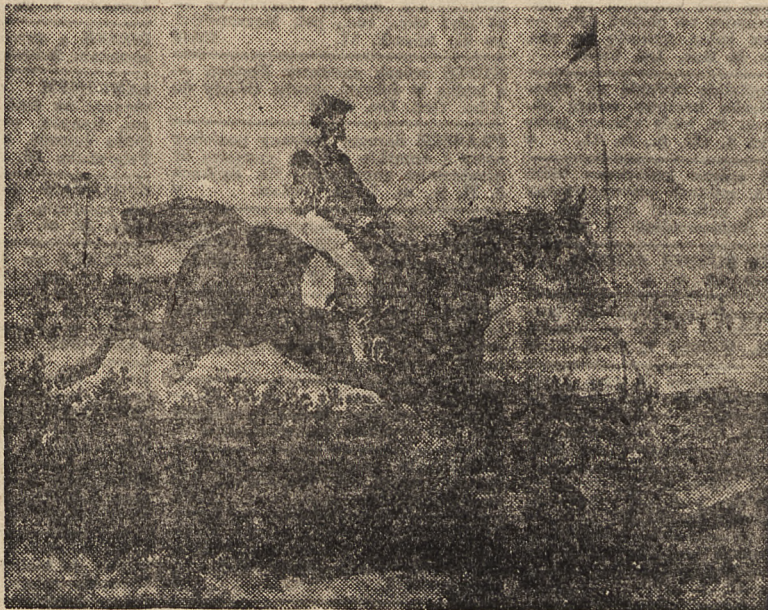
„HEKTRA” z galerii pamiątek lwowskiego toru wyścigowego z minio- nego stulecia. (Z akwareli Juliusza Kossaka)

W r. 710 przybyli Maurowie (szczęp arabski) do Hiszpanii i panowali tamże ośm wieków. W czasie tym zagęścili się konie wschodnie na pirenajskim półwyspie, gdzie osobliwie sucha ziemia i gorzyste po-