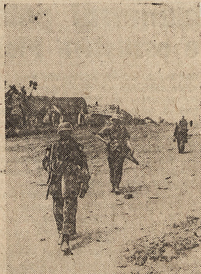
W marszu przez wieś na wschodzie

Reasumując te wiadomości, dzienniki francuskie stwierdzają, że Anglicy i Amerykanie są na terenie francuskiej Afryki Północnej czynnikami torującymi drogę bolszewizmowi oraz kwatermistrzami bolszewizmu, żonglując błyskotliwym frazesem oswobodzenia Francji. Łatwo jednak można poznać, że oczekowana przez anglo-sasów wolność oznacza nic innego, jak tylko chaos bolszewicki.