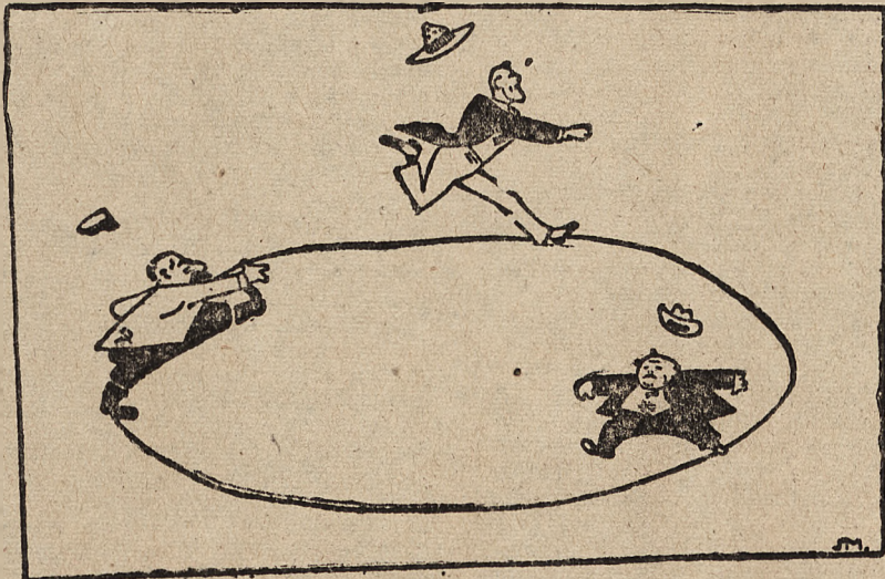
„Demokraci“ w zaczarowanym kole.