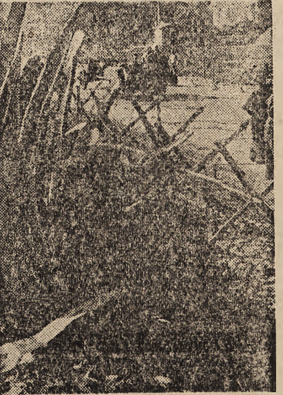
Niemieckie oddziały zmotoryzowane we Włoszech na flory śródziemnomorskiej

ZAGRZEB, 13. 10. — Donoszą urzędowo, że na propozycję chorwackiego premiera Poglavnik zmienił z obowiązków ministrów dotychczasowych i zamianował nowy rząd.