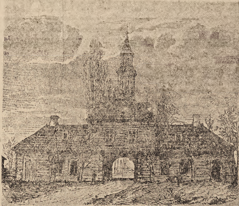
Brama wjazdowa do dworu

Piękny to widok, gdy w promieniach słońca po lśniących wartkich falach Czeremoszu mkną jeden za