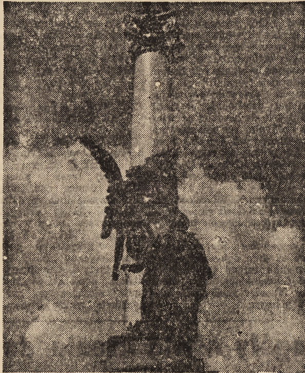
Udatne studium światła w zdjęciu kandydata egzaminu czeladnika zawodu fotograficznego.