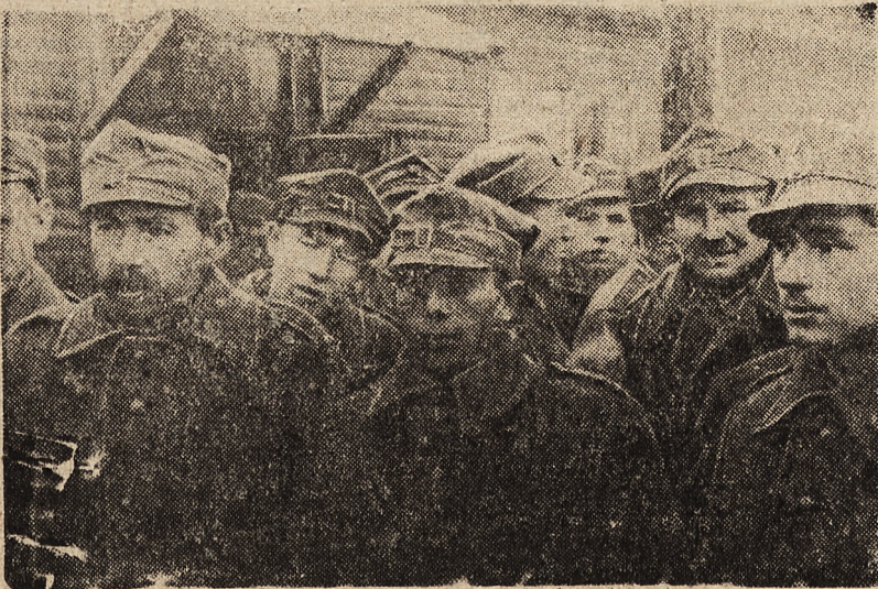
Żołnierze dywizji im. Łucjusza Kościuszki

BERLIN, 11. 12. — Oświadczenie złożone przez tureckiego ministra spraw zagranicznych Menemencoglu wobec przedstawicieli prasy na konferencji prezydenta państwa tureckiego z Churchillem i Rooseveltem wskazuje — jak podkreślają w kołach politycznych stolicy Rzeszy — że wbrew oczekiwaniom brytyjskim oraz wbrew usiłowaniu w kierunku wmanewrowania Turcji do wojny widocznym jest, iż dotychczasowa polityka prezydenta państwa tureckiego będzie nadal zachowana. Polityka opiera się na podstawowej woli do zachowania neutralności. Stanowisko to powstrzymuje Turcję od dopuszczenia do zawikłania jej w wojnę, na której nie może ona nic zyskać.