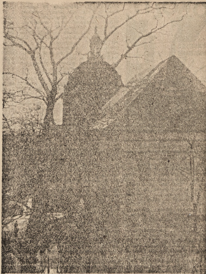
Baszta prochowa i kopuła dominikańska wciągają się w piękny zespół, piękny i wtedy, gdy go nie zdobi zielen drzew

złożyli w Delegaturze R. G. O. (Referat Poszukiwań Zaginionych) — Lwów, Sobieskiego 15: Uczniowie „Auto-Union” 21,05 zł; Nadawcy paczek do Rzeszy 414 zł; Pracownicy f-my „Delta I” w Brosznie 820 zł; Polska szkoła w Wołowie k/Bóbrki 80 zł; Pracownicy Ostbahn-Bauinspektion 168 z i 10.50 kg żywności; kl. III. Szkoły powsz. SS. Nazaretanek 3 paczki; kl. I b. III b. IV b Szkoły powsz. im. św. Teresy 4 paczki; Szkoła powsz. Nr 16 (pl. Gosiewskiego 4) 6 paczek i 20.80 kg żywności; Delegatura Pol. K. O. w Kulikowie 3 paczki i 1,35 kg żywności.