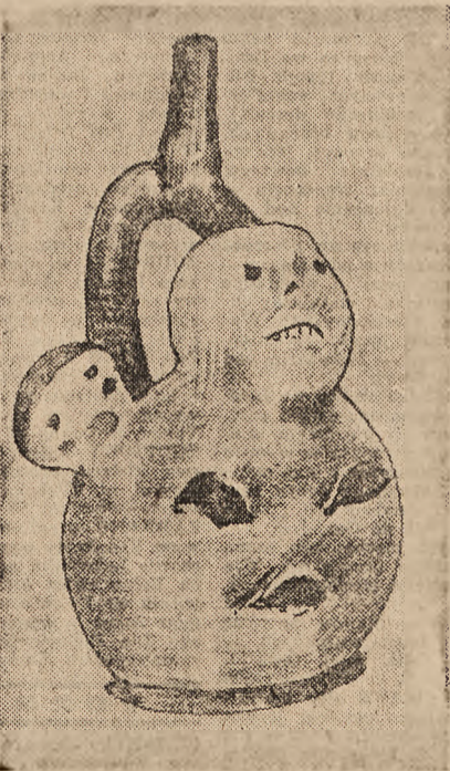
Starożytny rytualne naczynie z Peru w kształcie bulwy kartoflanej