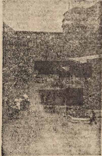
Na po'wózu lwowskiej krupniarni ustawiony ruch dostawy surowca i odbioru produktu

„Kasza wysługa nasza” mawiano niegdyś przedstawiając skromne wa-