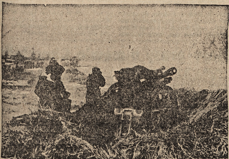
Artyleria niemiecka ostrzeliwuje pozycje bolszewickie