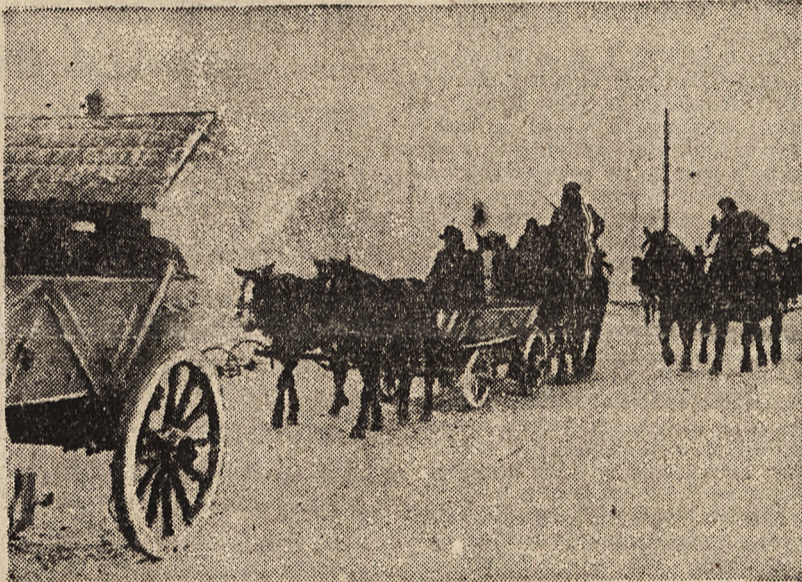
Tabory niemieckie przejeżdżają przez płonącą wieś na północnym odcinku frontu.

Faktu tego nie może zmylić okoliczność, że od trzech dni w rejonie na południe od Pskowa rozgorzała nowa bitwa obronna. Ilość użytych tu formacji sowieckich nie jest wprawdzie nieznaczna, jednak w każdym razie ograniczona. celem zasilenia tej nowej próby przełamania, zakrojonej na wielką skalę.