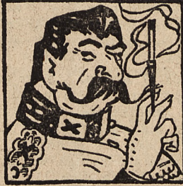
Prezydent Polski Staliński