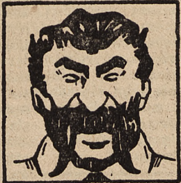
Prezydent Finlandii Stalinsson