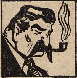
Prezydent Skandynawii Stalinsen