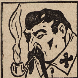
Marszałek ZSRR Stalin

karykaturach holenderskiego rysownika, reprodukowanych w pewnym dzienniku holenderskim. Objaśnia on za ich pomocą swych rodaków, o losie Europy w wypadku zwycięstwa bolszewizmu w tej walce na śmierć i życie. Na szczęście nie sądzono jest Stalinowi decydowanie o przyszłości Europy.