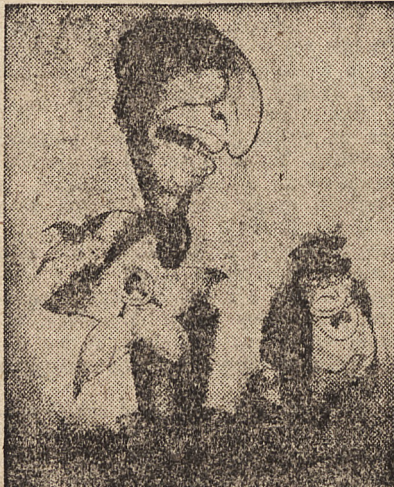
Wyrośnięty ponad głowę.