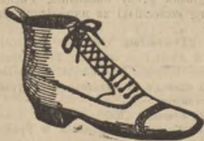
Znany w świecie kamaszek „Goodyear“